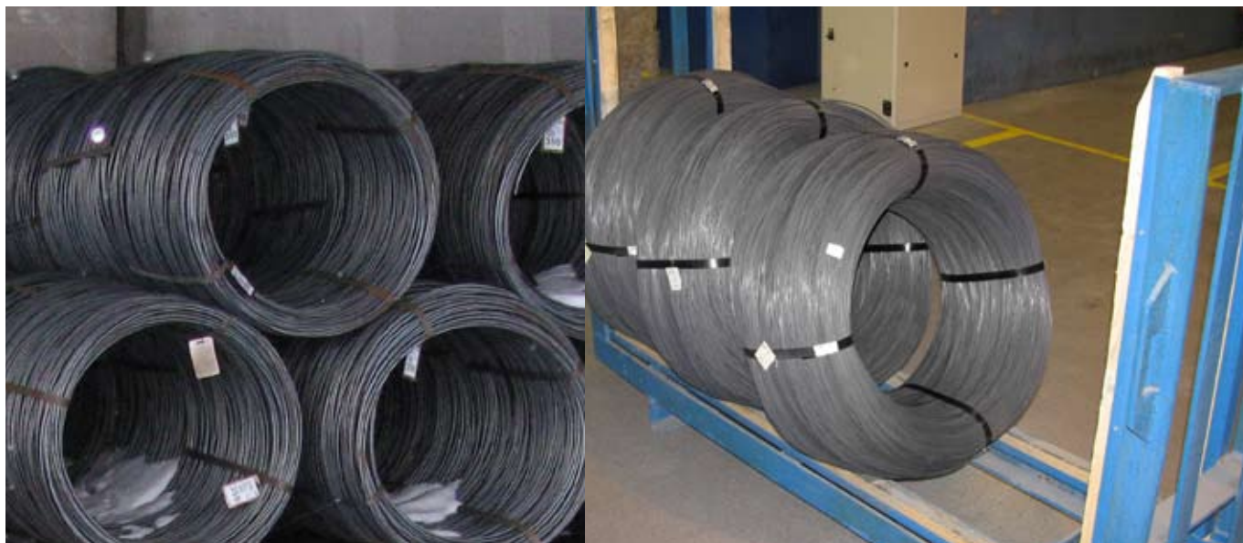
Valstråd på gummimatta